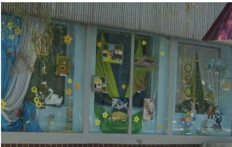
Постійно діючі виставки творчих робіт гуртківців